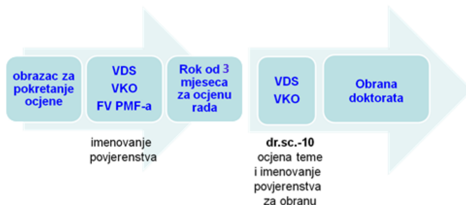
Slika 2. Postupak ocjene i obrane disertacije

Doktorand je dužan obavijestiti mentora o pokretanju postupka ocjene doktorskoga rada. Mentor je obvezan doktorandu dati pisanu suglasnost i mišljenje o provedenom istraživanju i postignutom izvornom znanstvenom doprinosu. Predanu završnu tezu ocjenjuje povjerenstvo od 3 ili 5 članova koje imenuje VKO na prijedlog VDS-a. Članovima povjerenstva mogu biti imenovani nastavnici i znanstvenici u zvanju docenta, odnosno znanstvenog suradnika, ili višem, koji su znanstveno djelatni u znanstvenom području / polju kojem teza pripada. Po prijehu povoljnog izvješća o predanoj tezi, VKO, na prijedlog VDS-a, imenuje povjerenstvo za obranu teze, primjenjujući gornje kriterije, s time da za obranu teze treba imenovati još i barem jednog zamjenika, slika 2. Mentor ne može biti član povjerenstva za ocjenu niti za obranu disertacije.