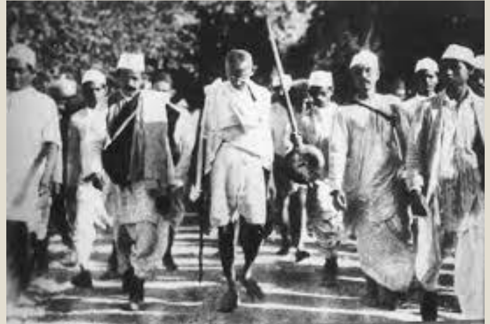
Sl. 5. Ghandi kao vođa pokreta za neovisnost Indije od britanske kolonijalne vlasti