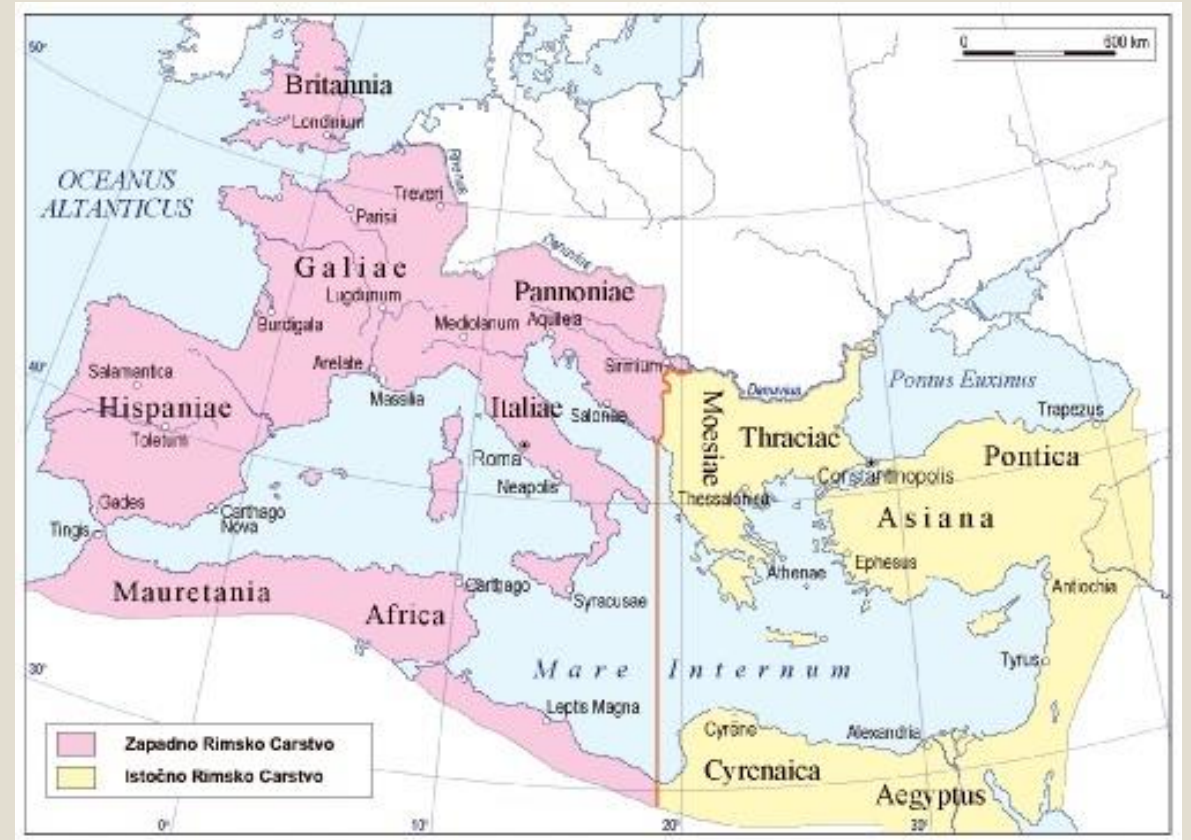
Sl. 1. Zapadno i Istočno Rimsko carstvo