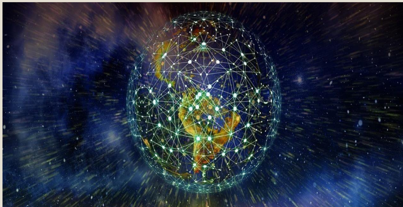
Sl. 3. Svjetska umreženost – ilustrativni prikaz