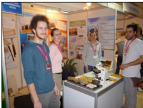
Gužva na štandu.

Vjesnik bi ipak trebao paziti što reklamira! Pogledajte ovu reklamu za kupnju seminarskih i diplomskih radova (u okviru), što je kriminalna radnja! Ako pišu protiv korupcije i kupovanja ispita trebaju se i djelatno zalagati protiv tih zloraba, a ne podržavati ih!