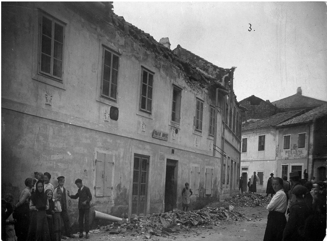
Posljedice potresa od 12. ožujka 1916. u Grižanama.