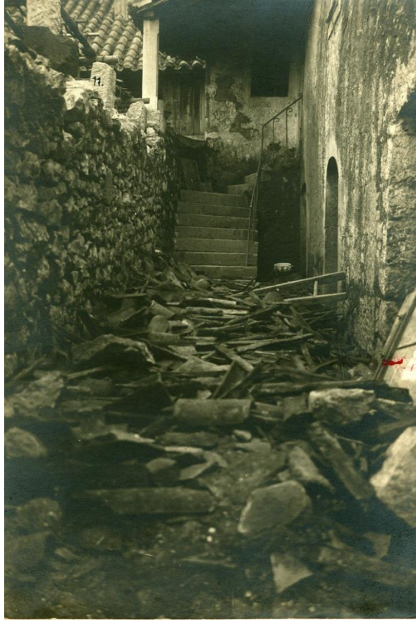
Posljedice potresa od 12. ožujka 1916. u Grižanama.